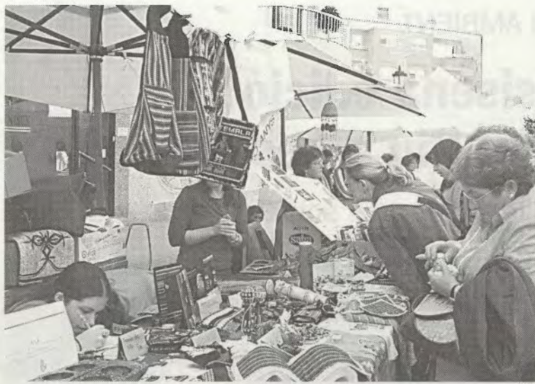
Paradas en una edició anterior de la festa

L'acord compromet l'entitat a prestar un servei de col·laboració i ajuda en les situacions puntuals d'emergència i d'atenció a les demandes socials que s'acordin conjuntament amb el consistori, així com també a fer-se càrrec del transport de persones amb disminució a centres d'educació especial, tallers ocupacionals i centres de dia de Sabadell ■