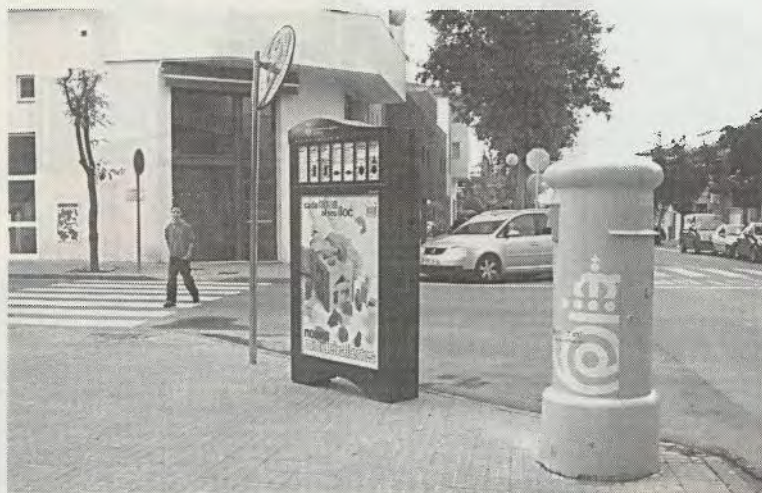
Uno de lo contenedores instalados

El convenio permite a la compañía a explotar la publicidad de los paneles en los que se encuentran los receptáculos a cambio de encargarse de vaciarlos y transportar los resi-