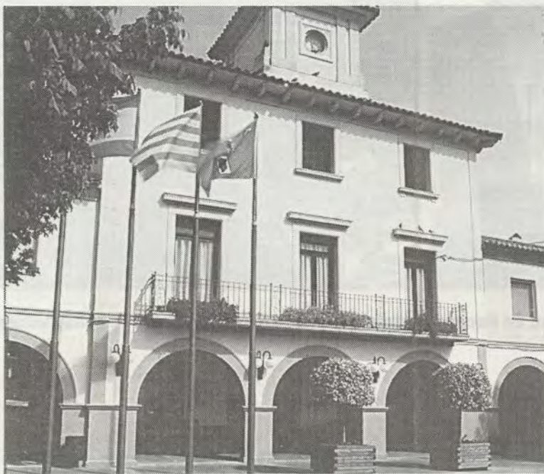
El Ayuntamiento ha enviado alegaciones al proyecto

Además, reclama la necesidad de que el trazado proyectado no entre en contradicción con la modificación prevista para la carretera B-142 (de Santa Perpètua a Sentmenat por Polinyà), que se desplazaría unos metros a la altura de a